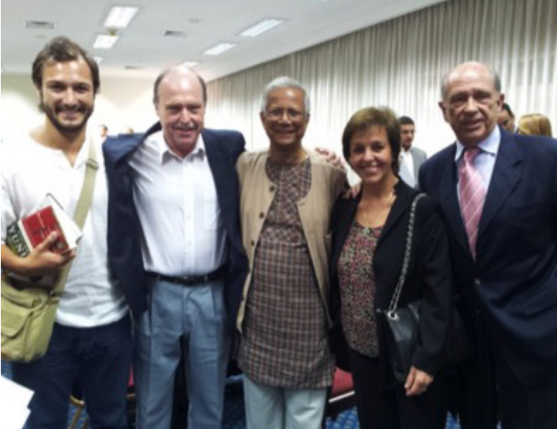
Muhammad Yunnus en Uruguay – 2013