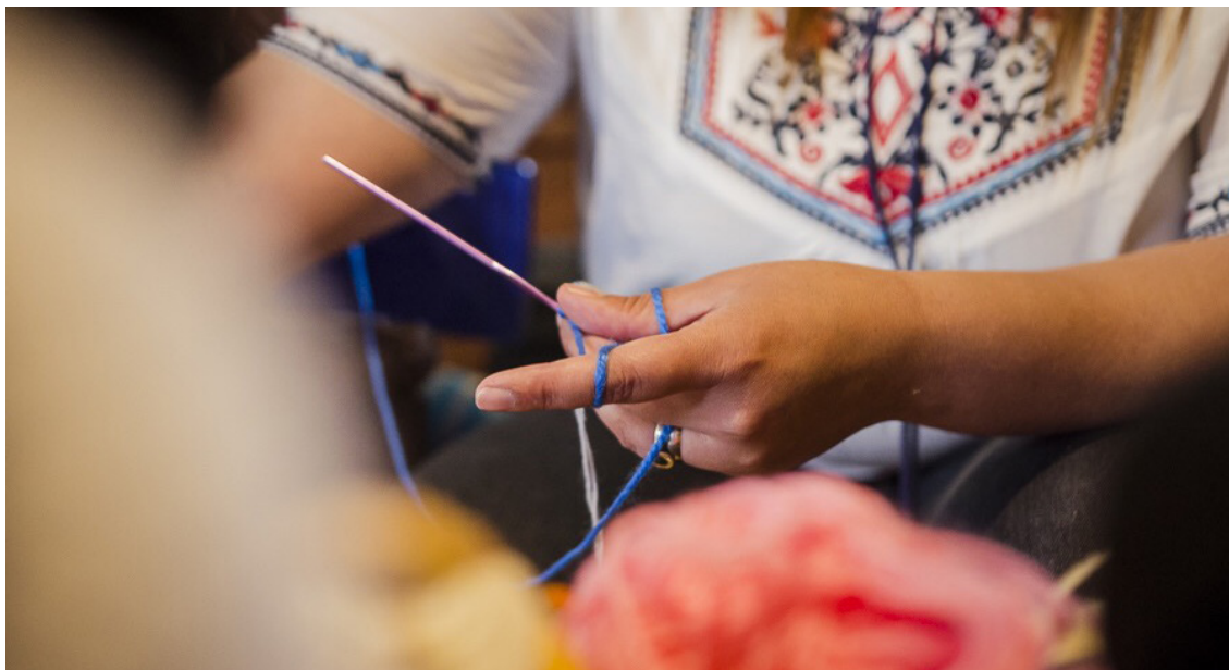
Emprendedora de San José